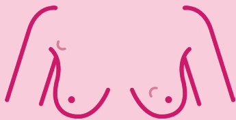
Hnútur eða fyrirferð í brjósti, ofar á bringu eða í handarkrika

Nánari upplýsingar: krabb.is/einkenni-brjost