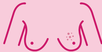
Útbrot, hreistrug húð eða sár sem ekki grær á geirvörtu eða í kringum hana