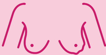
Áferðarbreyting á húð, er t.d. ójöfn