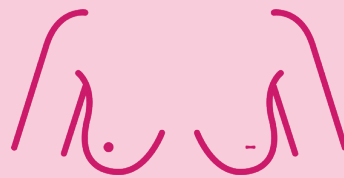
Breytingar á geirvörtu t.d. að hún hafi dregist inn